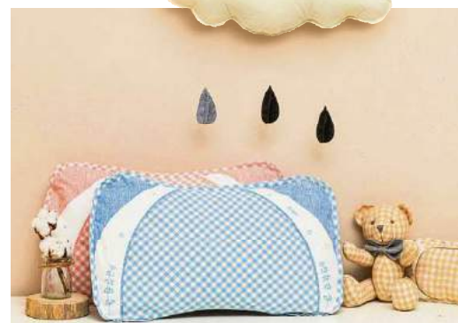
Warum regnet es immer über mir? Ungewollt Kinderlose fühlen sich von der Natur oft ungerecht behandelt – der Wickeltisch bleibt leer.

■ Jedes Jahr im September läuft die Woche der Kinderlosigkeit – 2017 als Kampagne ins Leben gerufen, um das Stigma der Kinderlosigkeit zu beseitigen und denen eine Stimme zu geben, die sich ausgegrenzt und isoliert fühlen, weil sie trotz Kinderwunsch keine Kinder bekommen können. Seit 2019 stellt das Land NRW verstärkt Mittel zur Verfügung, zu meist Zuschüsse für künstliche Befruchtung.