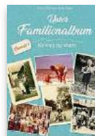
Das Buch zur Serie. Howahl/Schürmann: Unser Familienalbum, Klartext, 120 Seiten, 14,95 €

ger; Eck machte den Abfänger vor der Abwehr; Freddy war der ruhige Passgeber; Zolly, der geniale Dribbler, konnte seine Gegenspieler auf einem Bierdeckel auspielen, hatte aber so gut wie keine Kondition. Dann schlug die Stunde für Matthes als Einwechselspieler. Der rauchte und soff auch wie ein Hauddegen, konnte aber rennen wie ein afghanischer Windhund.“ Wer bitte wäre damals nicht gerne dabei gewesen, wenigstens als Schlachtenbummler. Doch was wurde aus der Karriere?